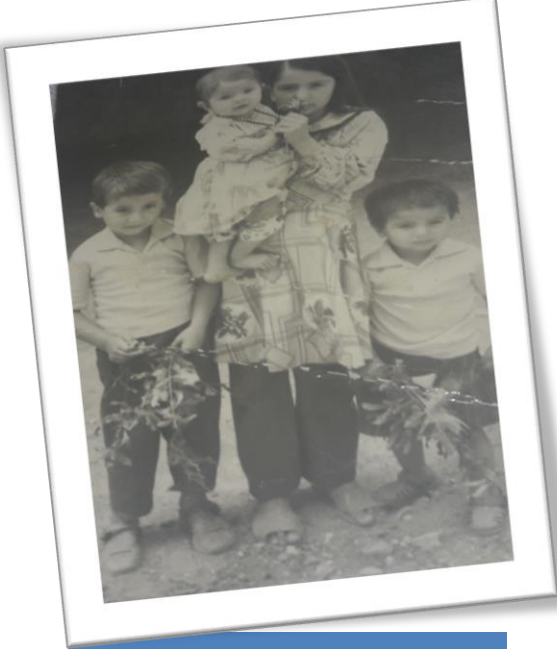
4 Çocuğuyla birlikte...

Adana'ya gelmişti. Bu sefer adamla görüşmeyecekti Aklında farklı şeyler vardı. Evi buldu, kapıyı çaldı bir genç açtı Babasının evde olmadığını söyledi. Mehmet ise bekleyecekti içeri geçti uzandı. Sonra adam geldi, adamın kim olduğunu söyledi. Çocuk ise durumu anlattı.