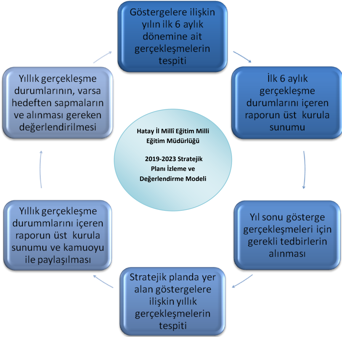
Şekil 3: Stratejik Planı İzleme ve Değerlendirme Modeli